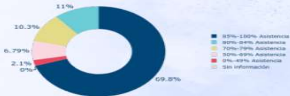
Gráfico 2.3: Porcentaje de estudiantes de sus establecimientos que tienen asistencia bajo 85%, según grado 2022: