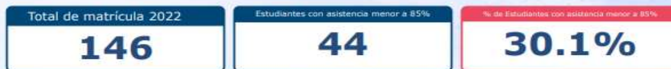
Gráfico 2.1: Porcentaje de estudiantes por establecimiento con asistencia bajo 85% en 2022:

Resumen sobre los estudiantes de sus establecimientos que entre marzo y noviembre muestran una asistencia bajo 85%. Ello se considera inasistencia grave, ya que podría estar anticipando la interrupción del proceso educativo de parte de los y las estudiantes.